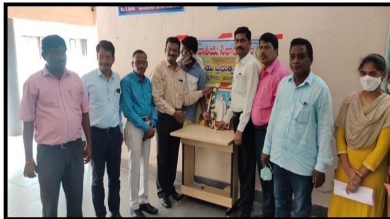
Telangana Bhasha Dinostavam