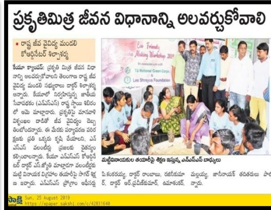
Ganesh Idol Making