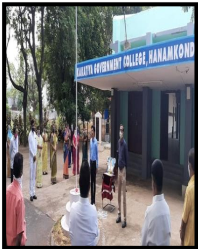
Telangana Formation Day

Sammakka Sarallamma Jathara: Sammakka Saralamma Jathara or Medaram Jathara is a tribal festival of honouring the goddesses celebrated in the state of Telangana, India. The Jathara begins at Medaram in Tadvai Mandal, Jayashankar Bhupalpally district. It commemorates the fight of a mother and daughter, Sammakka and Saralamma, with the reigning rulers against an unjust law. It is believed that after Kumbha Mela, it is Medaram jathara which attracts the largest number of devotees in the country, the NSS Units of our college visits he jathara and the NSS students work as volunteers in Jhathara