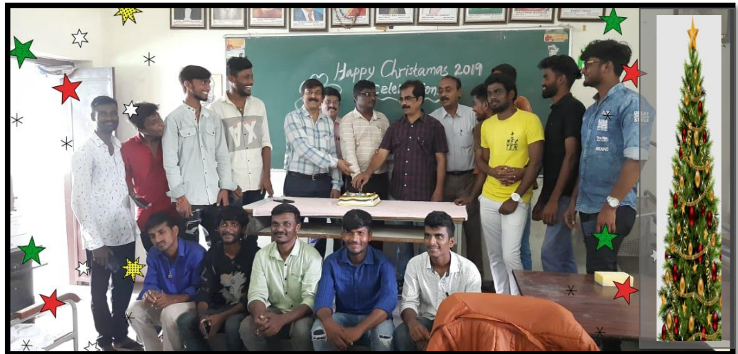
Chistamas Day celebrations in college campus