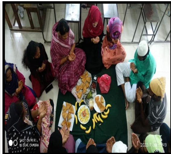
If tar celebrations with the staff and students