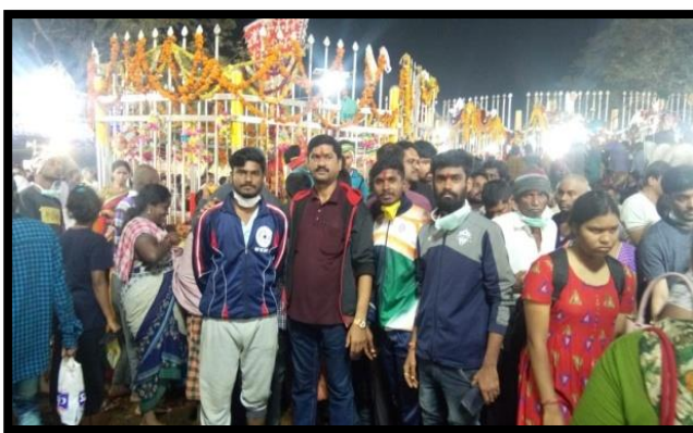
NSS Volunteers in Sammakka Jhathara