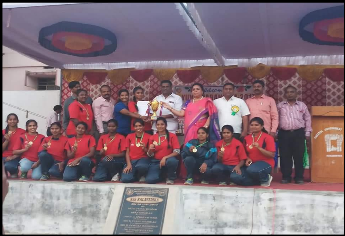
Students performance in Cultural Fest of the College